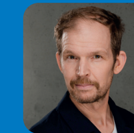
TIMO WOPP Comedian Kunst oder Blödsinn?