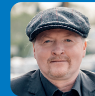
JOEY KELLY Musiker Kelly Family Ausdauersportler No Limits